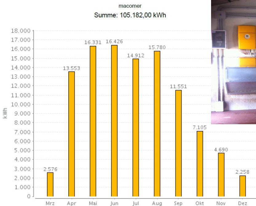
Jahresverlauf kWh - 2014

Google Earth Link: https://goo.gl/maps/u961bFf7RhL2